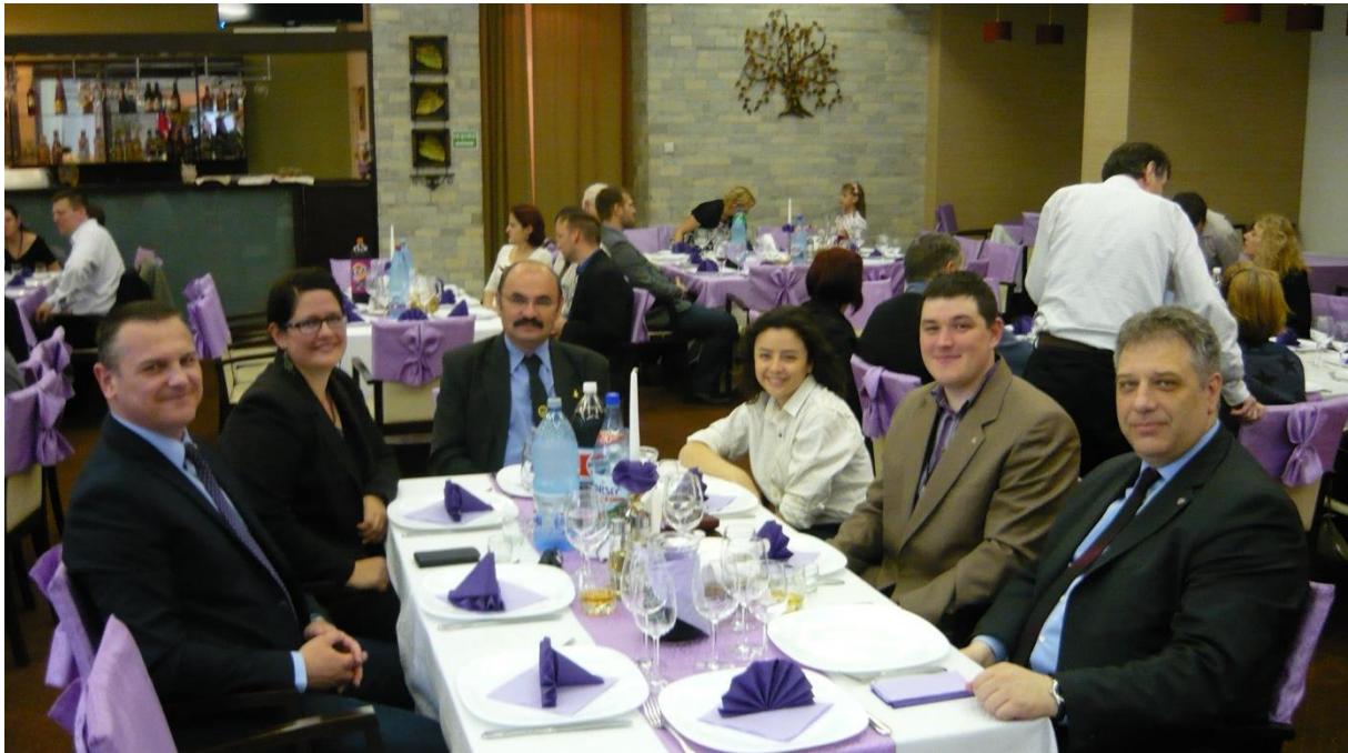
A BDI delegáció a SACI 2016 bankettjén