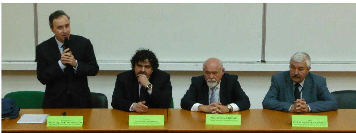
A SACI 2016 tudományos konferencia elnöksége