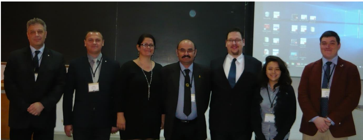
A SACI 2016 Biztonságtudományi szekció előadói