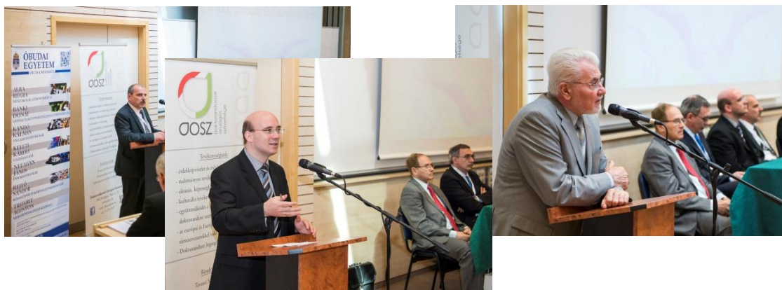
A megnyitó képekben